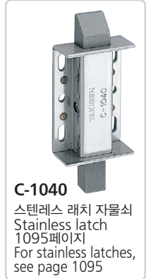
C-1040 스텐레스 래치 자물쇠 Stainless latch 1095페이지 For stainless latches, see page 1095