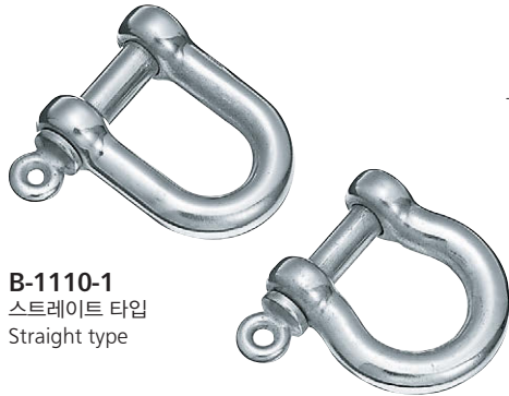
B-1110-1 스트레이트 타입 Straight type