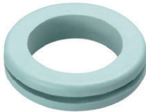
특주(Green-gray) 그린 그레이