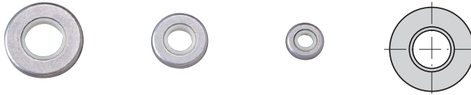
C-1029-WP-M8 C-1029-WP-M6 C-1029-WP-M3