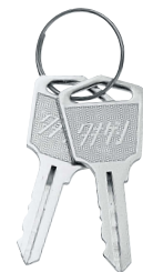
키 No.0200 Key