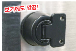
잠금 시: 잠금 상태가 되지 않으면 레버가 접히지 않는 구조입니다. Locking: Designed so that lever cannot be folded if unlocked.