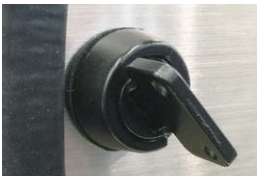
해제 시 Unlocked