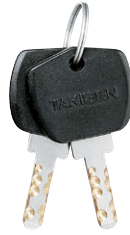
열쇠 다름 Key differences