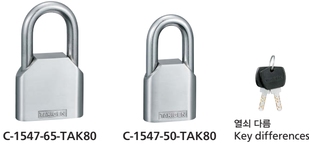
열쇠 다름 Key differences