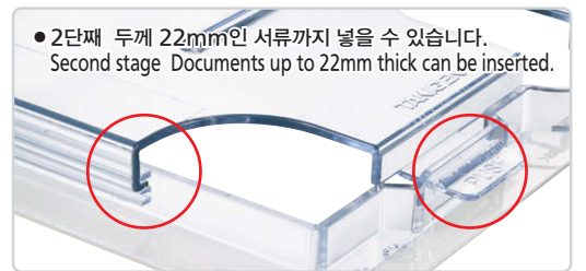
● 2단계 두께 22mm인 서류까지 넣을 수 있습니다. Second stage Documents up to 22mm thick can be inserted.