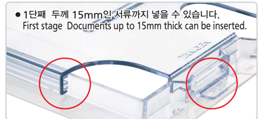
● 1단계 두께 15mm인 서류까지 넣을 수 있습니다. First stage Documents up to 15mm thick can be inserted.