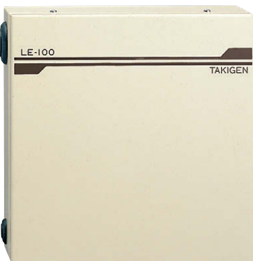
3연 추가 컨트롤러 Three-series additional controllers