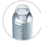
나사 선단부 Tip of screw