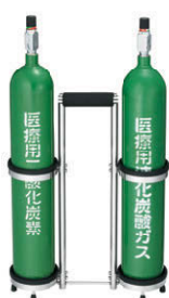
액화 탄산 가스 봄베 Liquefied carbon dioxide cylinders