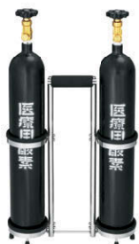
산소 봄베 Oxygen cylinders